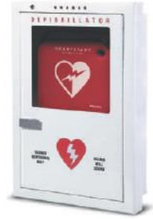
Premium Yarı Gömme Kabin

16" (41 cm) g, 22.5" (57 cm) y, 6" (15 cm) d