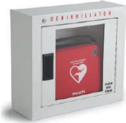
Temel Yüzeje Montaj Kabin

Acil medikal yanıtın mobilize edilmesine veya AED hırsızlığının engellenmesine yardım için Philips pil ile çalışan alarmlı üç farklı duvar kabini sunmaktadır. Temel kabin basit bir sesli alarm içermektedir. Ayrıca iki premium kabin mevcuttur: bir duvar yüzeyine monteli kabin ve daha az göze batan bir görünüm için duvarda açılmış bir girintiye sokulan bir yarı gömme kabin.* Premium kabinler sesli ve ışıklı alarm bileşimi içermektedir. Bunlar yüksek kalibreli sağlam çelikten yapılmaktadır ve örneğin oksijen gibi ilave medikal malzemeyi muhafaza edecek büyüklüktedir. Premium kabinler, aynı zamanda, iç güvenlik sistemine bağlanabilmekte ve böylece merkezi olarak daha koordineli bir acil yanıt mobilize edilmektedir.