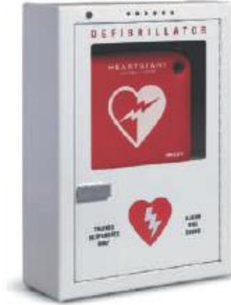
Premium Yüzeje Montaj Kabin

16.5" (42 cm) g, 15" (38 cm) y, 6" (15 cm) d